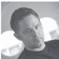
Dizajn: Carlo Borer

Ďakujem všetkým, ktorí sa zúčastnili prác na tomto projekte: Stuovi Lee za jeho zaujatie a nápady, Winnie Chowovej za pomoc a organizáciu, Claudii Fagagnini za skvelé fotografie a Carlovi Borerovi za jedinečný dizajn.