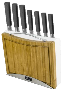
Držiak na nože s doskou