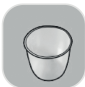
nádoba na meranie