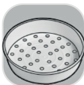
Nádoba na varenie v pare