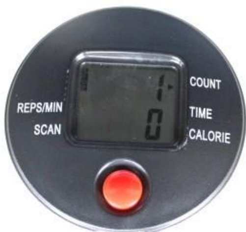
Hlavný prístroj x1